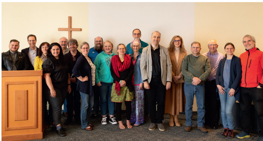
Kohtumine Horvaatias

Konservatiivsed metodistid tulid Slovakiast, Tšehhist, Bulgaariast, Horvaatiast, Hispaaniast, Makedooniast, Kosovost ja ka USAst, et üksteist tundma õppida ja rääkida sellest, kuidas me saaksime üksteist