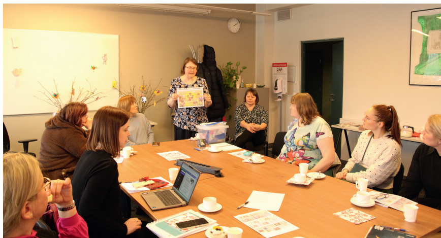
Lastetöötajate õppepäev