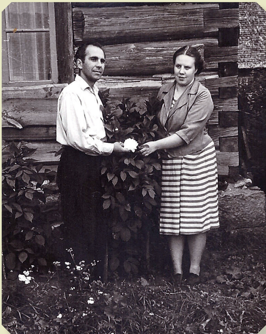
Alaveres Salu talus 30.08.1961

Rootsi sõpruskogudusse külla. Seal tabas teda ootamatult südameinfarkt. Mõne päeva pärast lubati ta haiglasse välja ja ta sõitis koju. 4. veebruaril soovis ta kindlasti osaleda pühapäevasel jumalateenistusel, kuigi tundis ennast veel nõrgana. Ta pidas veel kõne ja õnnis-