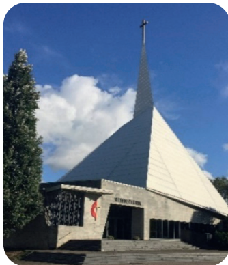
Uus kirikuhoone Narva maanteel