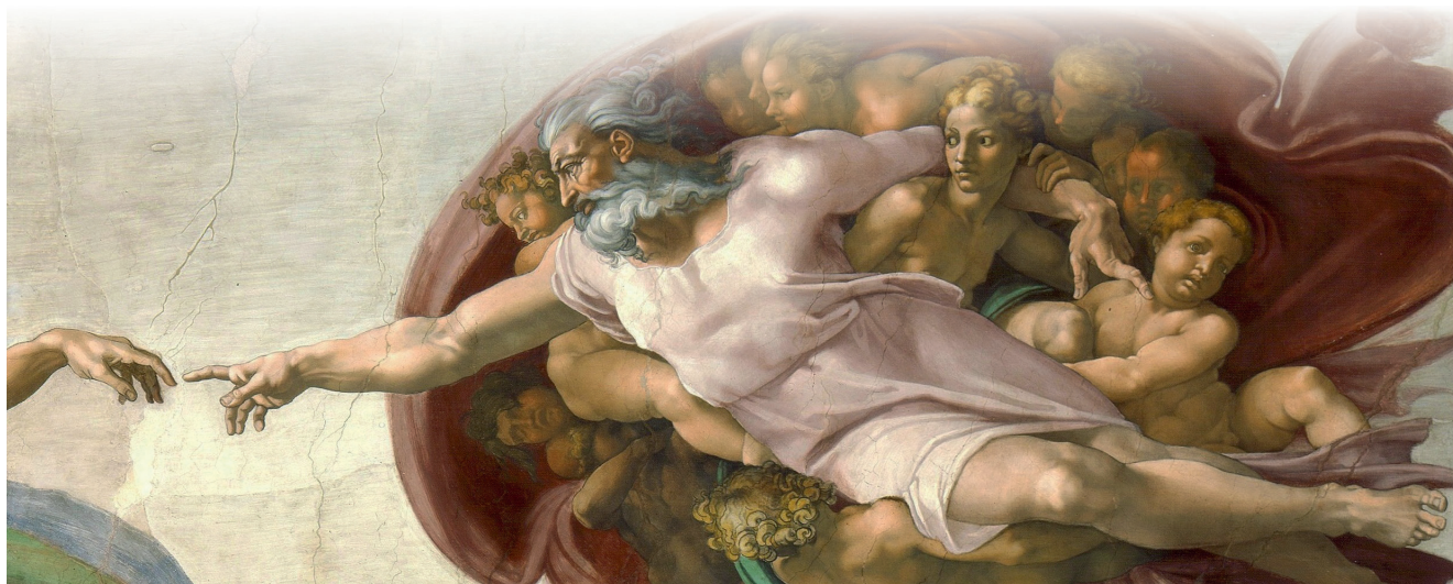
Fragment Michelangelo "Aadama loomisest"

Aga kuidas Jumala puudutus inimese elus päriselt välja näeb? Jumal puudutab meid läbi armuvahendite, eeskätt sakramentide kaudu. Läbi ristimise pestakse meie patt ära ja meid liidetakse Jumala rahvaga ning me saame igavese elu kaasosalisteks. Läbi armulaua aga saame osa Kristusest, Tema pühast ligiolust ja saame vaimselt kinnitatud, et seista vastu hingevaenlase tööle meie elus. Need hetked on erilised Jumala puudutused kristlase elus ja meil jääb vaid teha omalt poolt palju väiksem jõupingutus, võtta need armuvahendid vastu ja läbi selle kogeda Jumala puudutust.