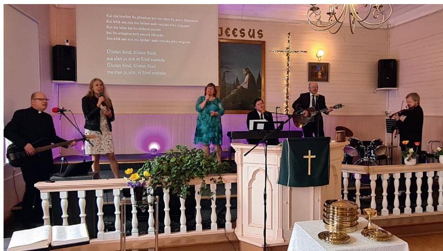
Läbi kogu konverentsi teenis muusikaga Kuressaare metodisti koguduse ülistusmeeskond