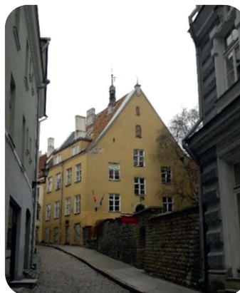
EMK Kirikukeskuse hoone Apteegi tn 3